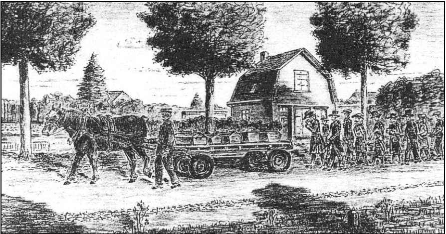
Impressie van de begrafenisstoet van de slachtoffers op 23 augustus 1943. tekening: Wout van den Hout

Dokter Balvers. Dat was geen Gilzenaar. Dat was een dokter uit het ziekenhuis in Tilburg. Het was wel een Tilburger geloof ik, maar dat weet ik niet meer. De oudste zus weet het wel: “Hij kwam uit Rotterdam. Daar had hij het bombardement meegemaakt. EHBO was helemaal zijn ding niet. Maar hij heeft mijn been ook afgezet. Het was een goede dokter, een leuke dokter, een goede man. Hijzelf is nu allang dood. Hij is jong gestorven. Na de oorlog is hij teruggegaan naar Rotterdam en toen naar Amerika. Dat was altijd zijn bedoeling