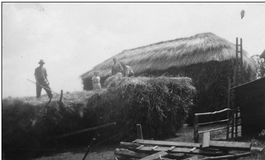
Het binnenhalen van de oogst in 1939.